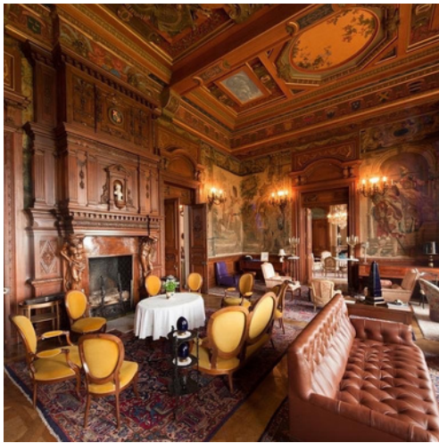
Le Grand Salon