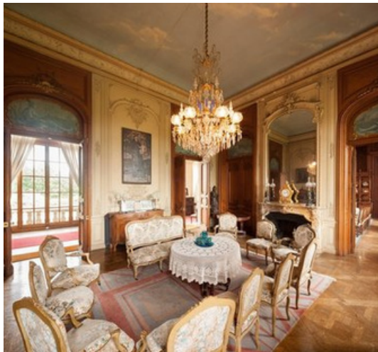
Le Petit Salon